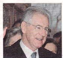
Governo Il presidente del Consiglio Mario Monti

come cresce la loro offerta digitale. E che la Rai mantiene una quota del 40,5% del mercato della tv generalista contro il 35,8% di Mediaset e il 23,7% delle altre