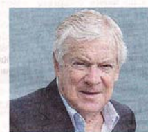
Vertici Paolo Garimberti, presidente della Rai

Cessione parziale Non verrebbero ceduti gli asset attivi, cioè le apparecchiature di trasmissione. Raiway non sarebbe dunque «venduta» nella sua interezza ma solo parzialmente ceduta o a un interlocutore pubblico, nel caso l'azionista (il ministero dell'Economia) considerasse strategica la rete di trasmissione: e allora si potrebbe pensare a Terna o alla Cassa di Risparmio di Roma. O invece, se si arrivasse a una gara europea, potrebbero essere interessati le multinazionali della telefonia e della comunicazione. L'affare, per loro, ci sarebbe comunque: